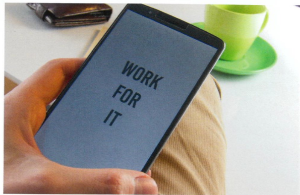
Längst haben sich virtuelle oder telefonische Coachings als effektivste Form der 1:1-Beratung etabliert.

Kein Wunder also, dass Sidepreneurship den Sprung in die Selbständigkeit besonders attraktiv macht und von immer mehr Menschen als Chance wahrgenommen wird. Doch wenn der Traum nicht schnell wieder platzen soll, gilt es einiges zu beachten.